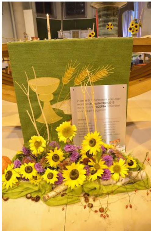
Gedenkplaat oprichting YouFra in de Sint-Pieterskerk te Loker